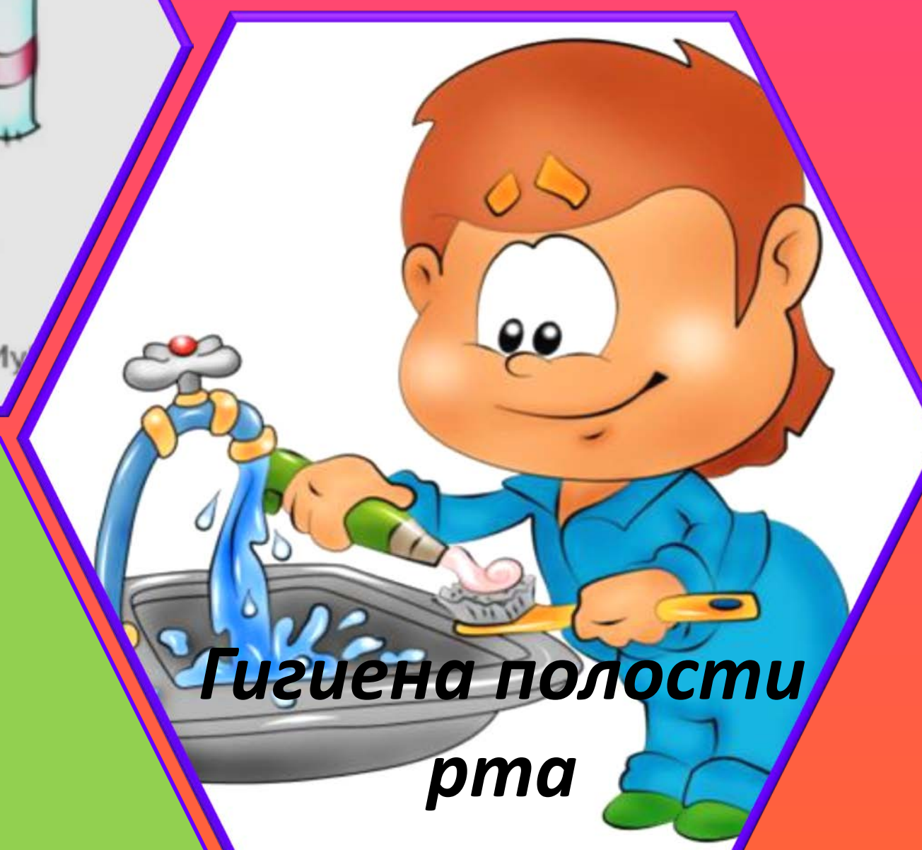
Гигиена полости рта